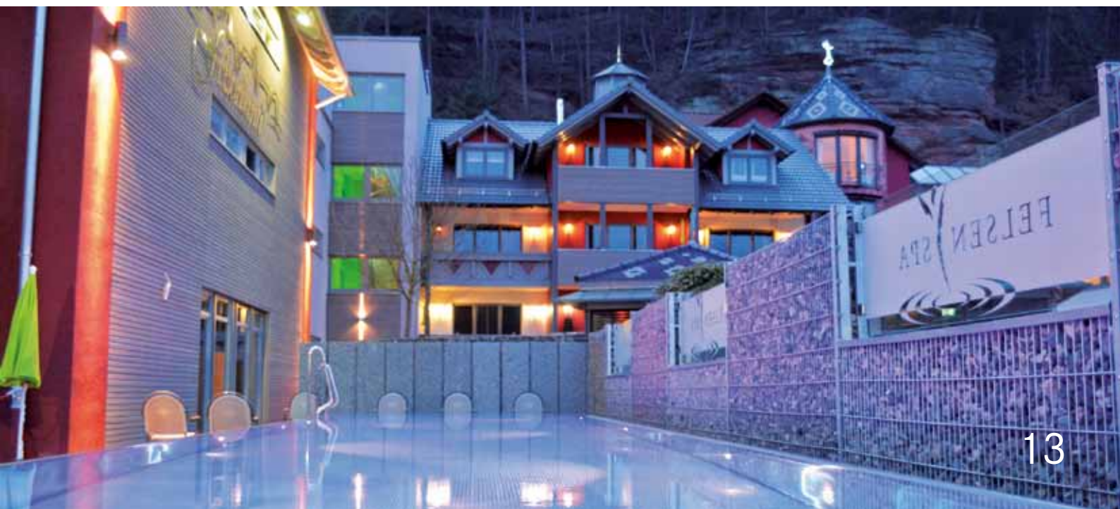
Das „Felsen-Spa“ des Hotels verbindet moderne Architektur mit natürlichen Elementen wie Stein und Holz.

Über zwei Millionen Euro investiert das Hotelier-Ehepaar in dieses Projekt. Auf Unterstützung der ISB kann es dabei wieder zählen: Über das Regionalförderprogramm, das vor allem strukturschwache Gebiete wie die Südwestpfalz unterstützt, hat die ISB erst vor Kurzem einen Zuschuss von 180.000 Euro zugesagt. ■