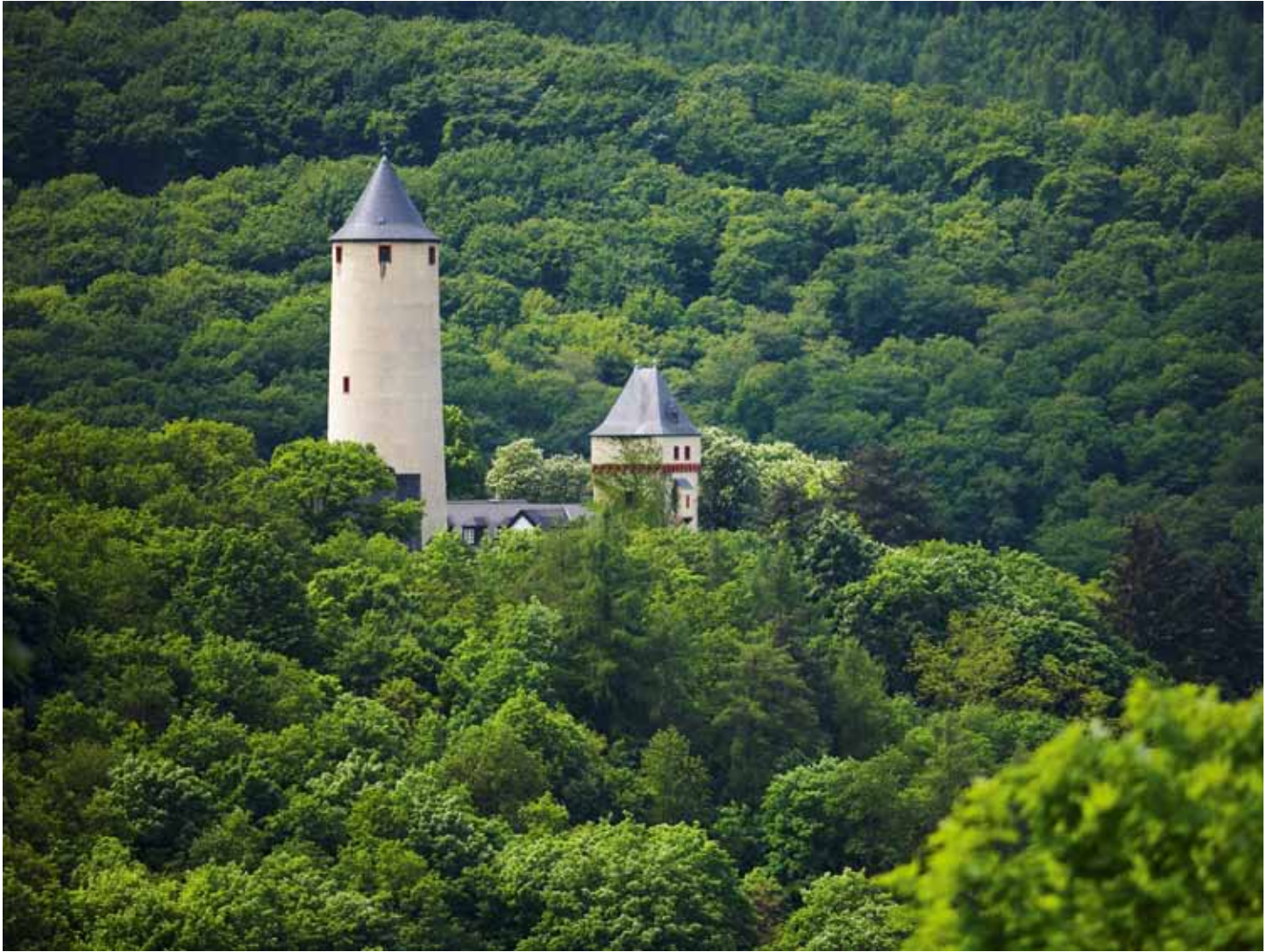
Natur und jahrhundertalte Geschichte sind zwei der wichtigsten Gründe, warum Touristen Rheinland-Pfalz als Urlaubsregion wählen.

über das, was dort wächst und was daraus bereitet wird. Wir haben so viele hervorragende Erzeugnisse, seien es Lebensmittel oder Weine. Es wird den Reisenden mehr und mehr Freude bereiten, ein Land oder eine Region kulinarisch zu entdecken. Das ist wahre Lebensart!