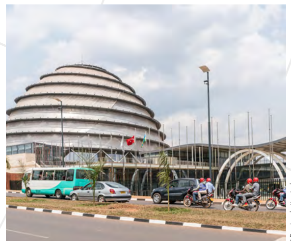
Convention Centre, Kigali