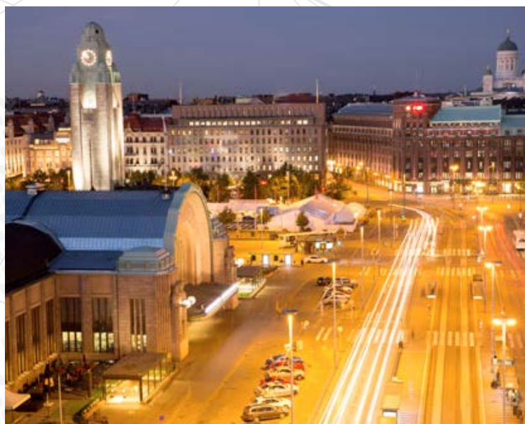
Helsinki Luftansicht bei Nacht